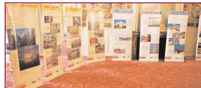
Débat de synthèse - 4 juillet 2006 Siège des AGF - Paris